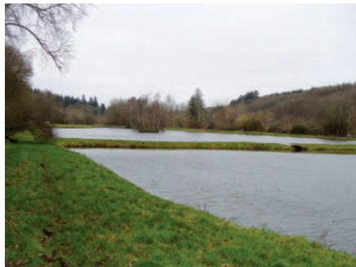
Les étangs de Conches en Ouche.